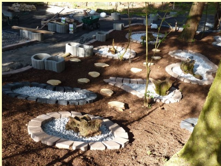
Noch gibt's viel zu tun