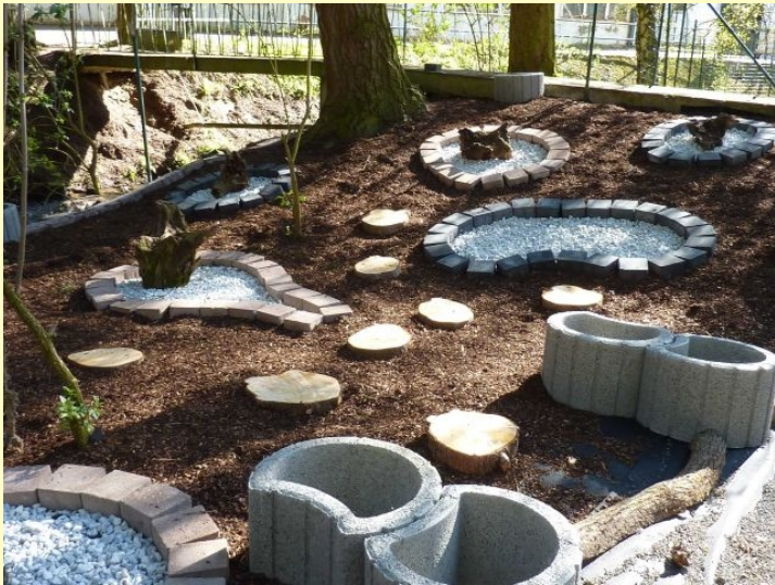
Erste Beete sind angelegt