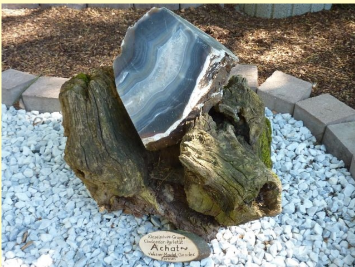
"Alte Steine" kurz erklärt.