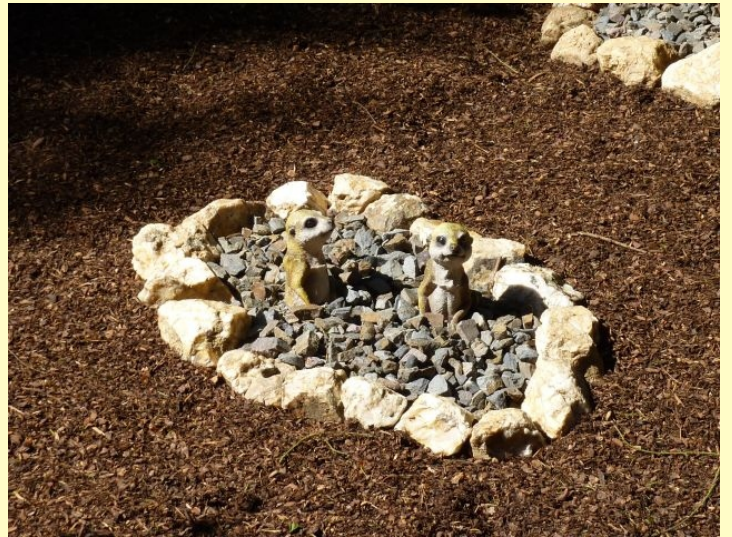
Die Erdmännchen sind schon da.