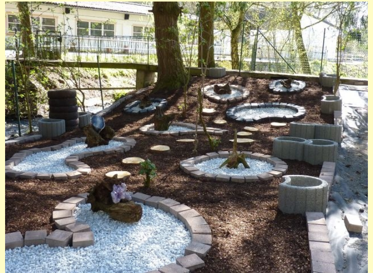
Auch Edelsteine finden einen Platz